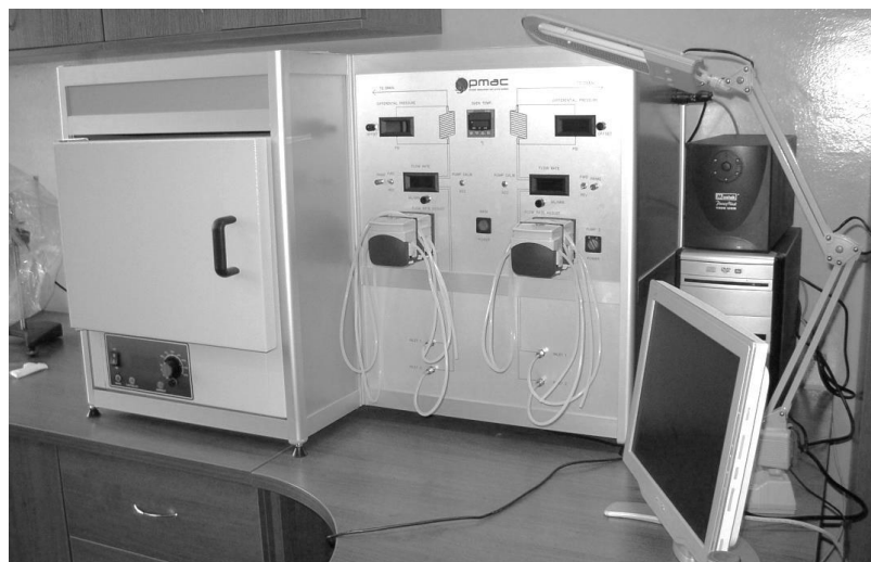
Рисунок 1 Модельная установка «РМАС SCL-30P-2А»

Для оценки эффективности ингибиторов в динамических условиях использована модельная лабораторная установка РМАС SCL-30P-2А (Великобритания) (рисунок 1). Методика эксперимента основана на определении давления в капиллярах теплообменника в результате образования накипи.